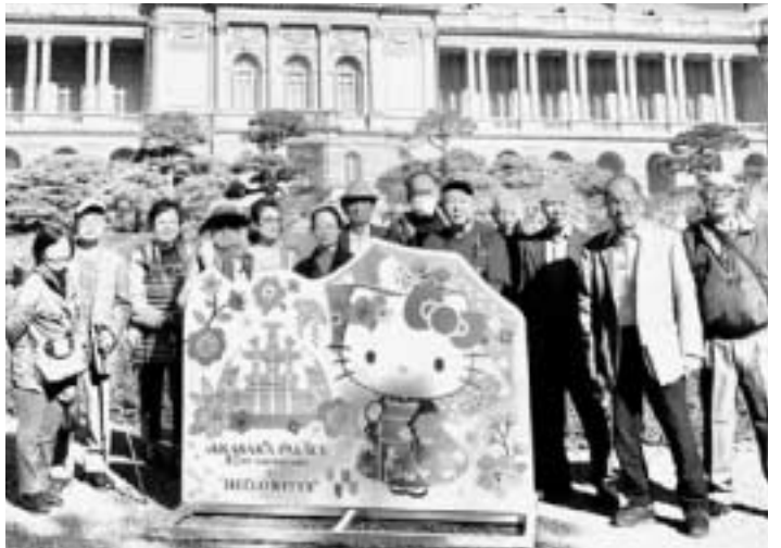
赤坂離宮の見学に14人が参加

墨田民商共済会は、1月17日に四ツ谷駅からほど近い迎賓館赤坂離宮に14人の参加で見学に行きました。「なかなか行く機会がないので行ってみたい」と、共済会の行事に初めて参加する人もいました。どのフロアも圧巻の豪華さで、参加者も幾度も息をのみながら興味深く鑑賞。建物内のおとは、噴水のある庭園や石畳の前庭をめぐりました。見学のあとは、休憩所にあるカフェレストランで昼食。 2009年の大規模改修のあとは、日本を代表する建築として、国宝に指定されています。ぜひ施設です。