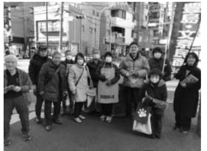
千駄木駅前から宣伝スタート(豊島・文京民商)

「消費税は減税しかない。がんばってください」と快く署名に協力した。マイクでの訴えを聞き、道行く買い物客も署名に応じてくれました。会員の方向けに「ぜひ知り合いを紹介して」と民商のチラシを手渡しました。民商のハッピーをみて「がんばって!」の声援もあり元気をもらいながら宣伝を行いました。 今回宣伝したハッピーロード商店街は、都道と再開発によって様変わり。クロスポイントはアーケードが取り壊され、大きなビルが建設され、商店数も激減しました。人も例年になく寂しい印象でした。 1軒1軒お店に入り、「民商です」と宣伝。商店の方も快くチラシを受け取ってくれたり、竹細工のお箸のお土産も下さるなど元気が出る宣伝になりました。よみせ通り