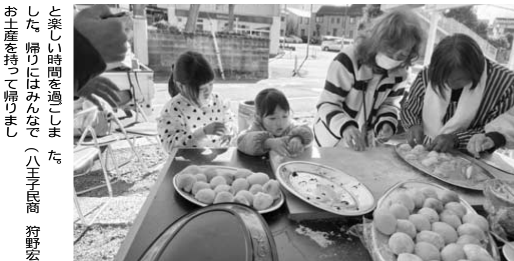
子どもたちもお手伝いしました！おいしそう

子どもたちも「自分たちも餅をついてみたい」と申し出たので一緒にしました。和気あいあいととても和やかな雰囲気でした。 つきあがったお餅はまず、事務所に飾る鏡餅を作ったのでお餅と一緒に「食べ、温かい豚汁は美味しいね」「大福もちもきな粉餅もおいしいね」と楽しい時間を過ごしました。帰りにはみんなで(八王子民商 狩野宏子)お土産を持って帰りました。