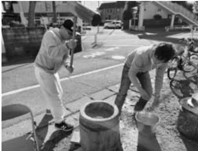
力強くおもちつき

昨年12月22日に民を5年ぶりに開催しました。子どもも含め17人が参加しました。