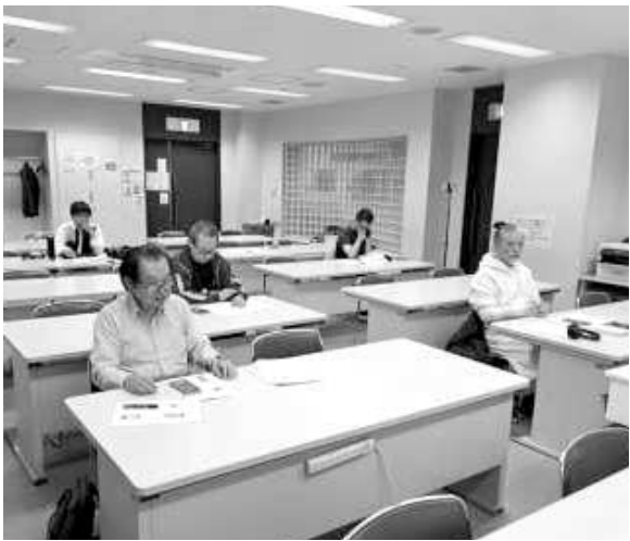
「アカウントを磨こう」をテーマに学習

「そもそもSNSとは？」、「SNSの種類」「SNSでできること、難しいこと」「SNSの投稿の仕方」などを3回に分けて学習会を開催してきた北区民商青年部5月14日に最後となった4回目のセミナーを赤羽文化センターで行いました。 最終テーマは「アカウントを磨こう」でした。前回はインスタグラムのアカウント（ページ）を開設し、参加者同士がフォロー（SNS上で友達になること）し合い、実際に投稿する所までを学びました。今回はインス