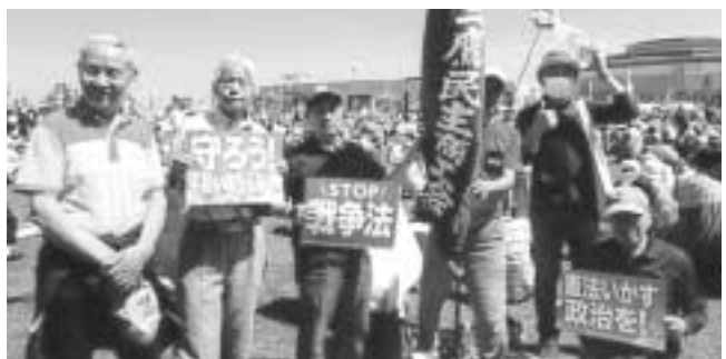
民商の旗を見て後日来所した人も(三鷹民商)