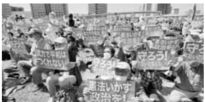
会場にバスで来ました(八王子民商)