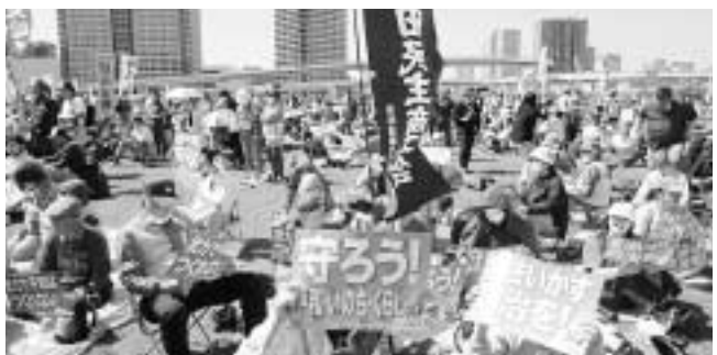
プラカードを掲げてアピール(蒲田民商)

憲法施行から77年を迎えた5月3日、全国各地で憲法を生かし、平和・命・暮らし・人権を守るうと集会・デモ行進が行われました。東京では今年で10回目となる「平和といのちと人権を! 5・3 憲法集会」が江東区の東京臨海広域防災公園で行われ、3万2000人が参加しました。 快晴のもと、参加者は「武力で平和はつけれない」「憲法いかす政治を!」とプラカードを掲げてアピールしました。舞台からは主催者、政党(立憲、共産、れいわ社民)、市民運動家のリ