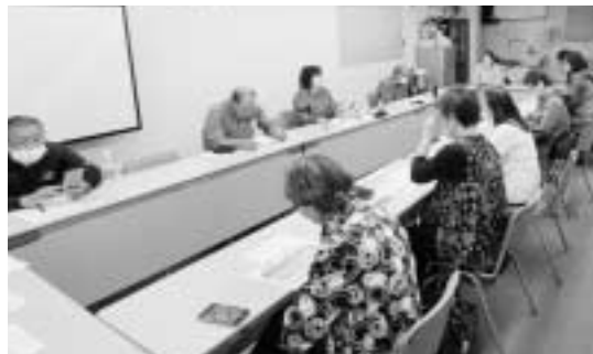
さまざまな意見に質問が出ました