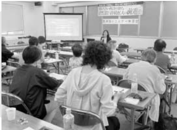
1時間半の講演はあっという間でした