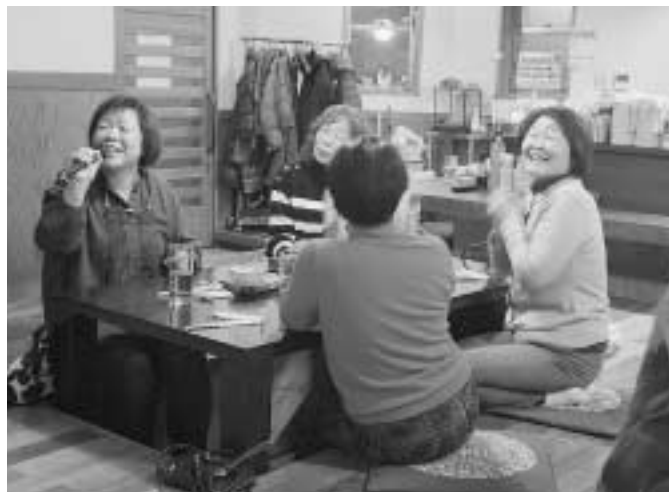
大盛り上がりしたカラオケタイム

八王子民商婦人部は、2月9日に居酒屋を営む部員さんのお店で、4年ぶりの婦人部新春のつどいを行い、10人が参加しました。