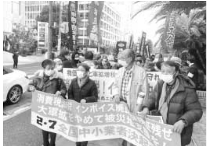
さまざまなプラカードや横断幕を持ってデモ行進へ！

参加者から「石川県能登町から参加した方の『能登は負けない』という発言は、涙が出そうなくらい心を打たれた」と進にも参加できてよかった。自民党の裏金問題に對する怒りがますます湧いてきたからこそ、春の運動を成功させたいなどの感想が寄せられました。