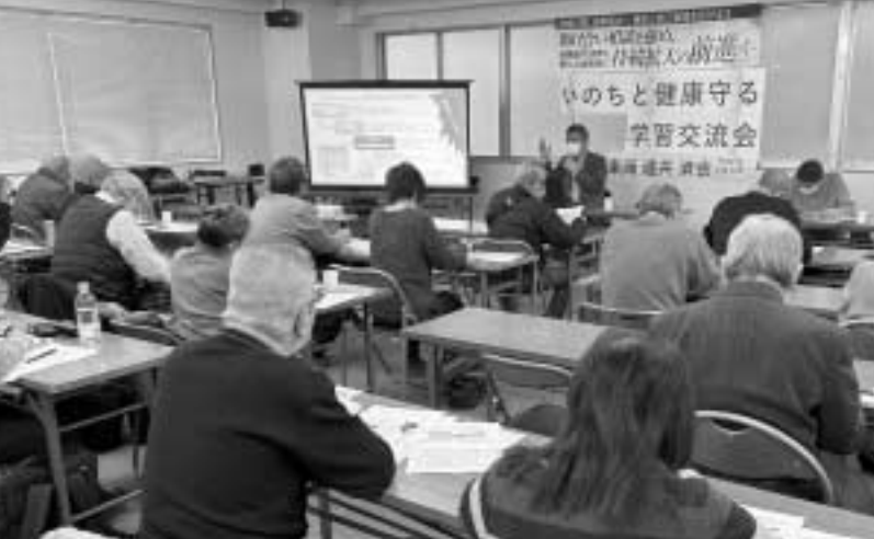
「社会保障のあるべき姿」をテーマにした講演