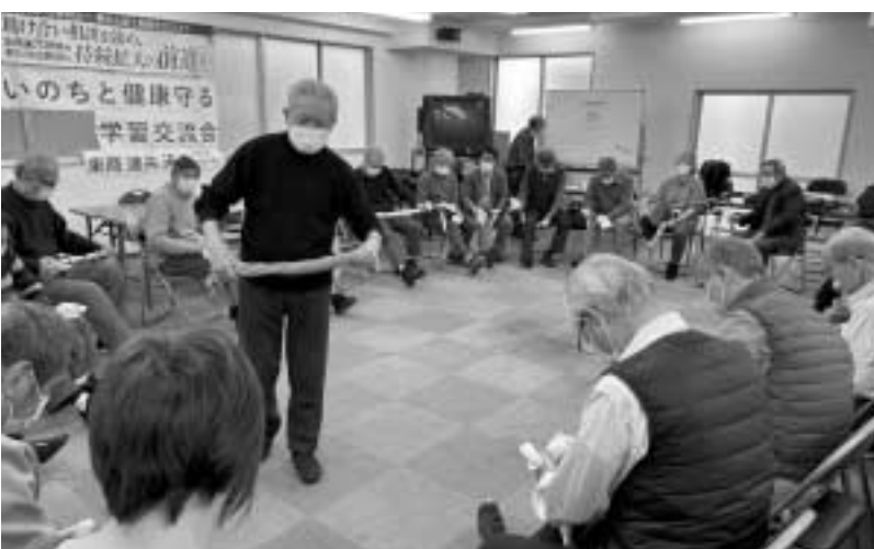
参加者全員でタオルマッサージを実践