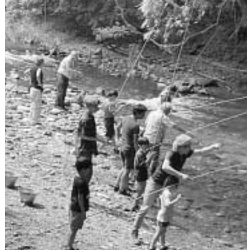
たくさんの参加者が釣りに挑戦しました

北沢民商は9月10日に4年ぶりに民商のレクリエーションを開催しました。場所は、山梨県上野原町にある鶴川渓谷です。子ども9人を含め38人が参加しました。 川で釣りを楽しんだり、バーベキューに舌鼓を打ちました。子どもたちも楽しく過ごせたと好評です。 (北沢民商 嶋 岩夫)