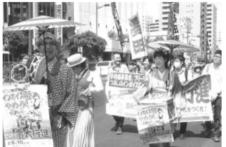
天気にも恵まれて浅草を行進

へ!」「全国一律最低賃金制度の確立を!」など、商店や観光客などへ訴え、コールで元気に行進しました。デモ行進を見ていた沿道の方たちからも一緒に