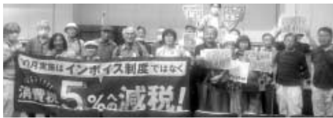
集会に参加した東京の皆さん

消費税率引き上げの布石となるインボイス(適格請求書)制度を中止せよと9月14日、永田町にある砂防会館にて全国中小業者決起集会が実施されました。全国商工団体連合会、全国保険医団体連合会、全国FC加盟