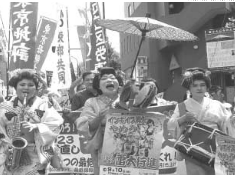
大行進を盛り上げるちんどん屋さん

へ!」「全国一律最低賃金制度の確立を!」など、商店や観光客などへ訴え、コールで元気に行進しました。デモ行進を見ていた沿道の方たちからも一緒に