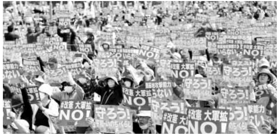
プラカードを掲げてアピールする2023憲法大集会の参加者たち

立憲民主党の西村智奈美氏、日本共産党の志位和夫氏、れいわ新選組の柳瀬万里共同代表、社民党の福島みずほ党首があいさつ。市民団体からの発言が続き、漫画家の東村アキコさんは録画メッセージを寄せ、「テレビで軍拡を巡る議論などはほとんど報道されませ