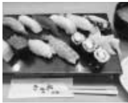
いただいたお寿司

蒲田民商青年部はこの間、3人の部員を迎え「部員同士のつながりを深めよう」と、4月25日に新入部員歓迎会を会員のお寿司屋さんで開催しました。住宅メンテナンスや建設業、不動産自動車販売業など5人が参加し、うち2人が新入部員でした。自己紹介をし、美味しいお寿司をいただいたながらお互いの商