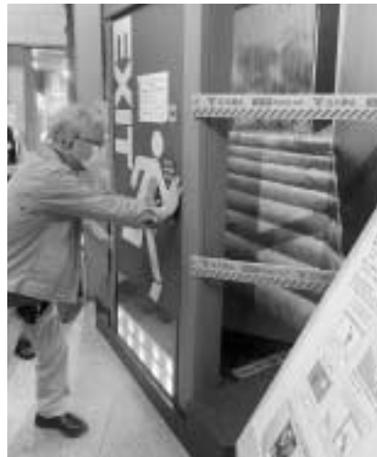
水圧がかかってドアが開かず....

4月30日、墨田民商共済会は本所防災館見学を行いました。本所防災館は、地震の揺れの体験、初期消火や応急救護、火災の煙からの避難要領など、防災に関する知識や技術を学ぶ体験施設で、池袋や立川にもあります。今回の取り組みに9人が参加しました。 防災体験ツアーでは、参加者は必死にドアを押して開けるのが難しく、