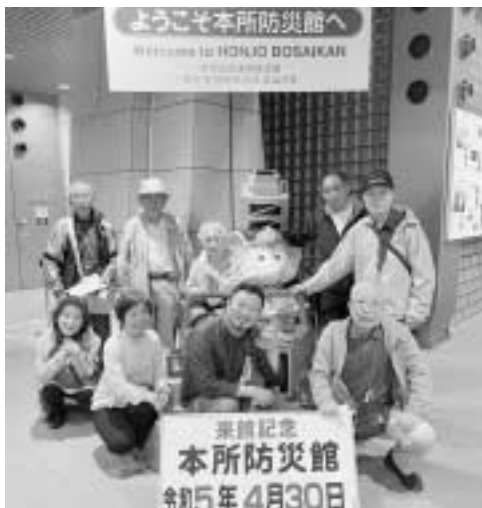
参加された墨田民商共済会の皆さん

4月30日、墨田民商共済会は本所防災館見学を行いました。本所防災館は、地震の揺れの体験、初期消火や応急救護、火災の煙からの避難要領など、防災に関する知識や技術を学ぶ体験施設で、池袋や立川にもあります。今回の取り組みに9人が参加しました。 防災体験ツアーでは、参加者は必死にドアを押して開けるのが難しく、