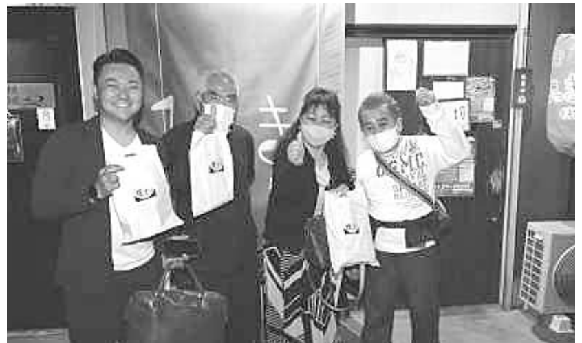
夜オリを楽しむ参加の皆さん