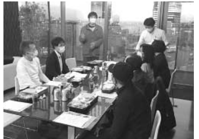
商売、スポーツ、民商のことなど話し合いました。

池袋の夜景をバックに「こういつ集まりはなかなか参加の機会がなかったので楽しかった」と喜ぶ声も聞かれました。