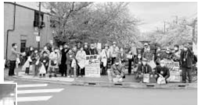
(上)板橋民商 桜がきれいな橋の上にて (左)練馬民商 石神井公園駅前で団結ガンバロー