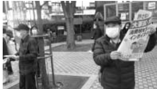
蒲田民商 JR蒲田駅前にて

蒲田民商 4月1日、消費税廃止大田各界連絡会、消費税をなくす大田の会合同で、インボイス制度の中止・廃止、消費税減税・廃止を求めて怒りの宣伝行動に取り組みました。大田、蒲田、雪谷民商も各地の宣伝行動に打