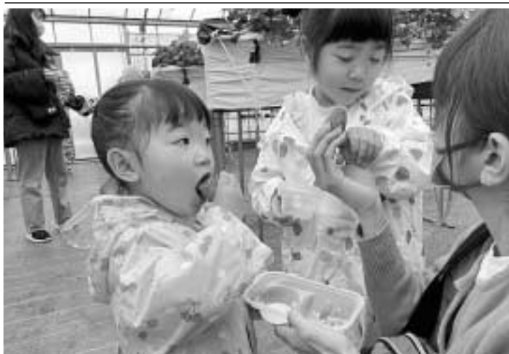
大きい苺をパクッと!

3月24日に石神井公園駅前にて、民商も加盟する団体で「ねりまインパクト」と称した大宣伝行動に取り組みました。「インボイス制度導入中止、消費税を5%に戻せ」と各業界・団体・税理士が次々と訴えました。チラシを受け取った