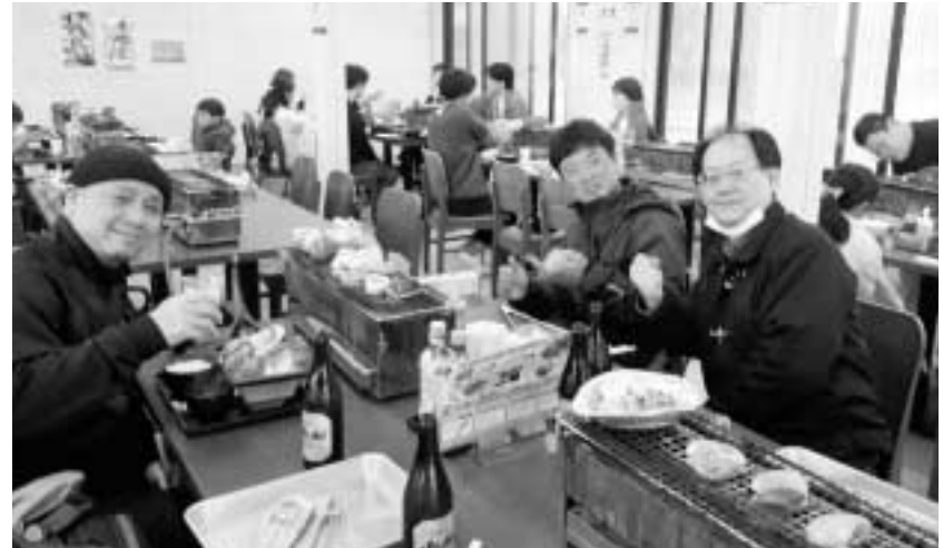
海の幸を堪能しながら交流していました。

東青協は5月21日にもBBQを開催予定。業者青年実態調査を呼びかける中で、青年部の活性化にも取り組んでいきます。