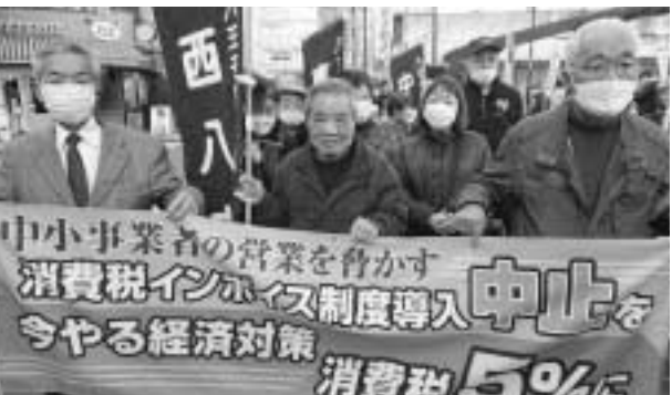
3年ぶりのデモ行進(八王子) インボイス制度の中止や消費税の減税のシュプレヒコールをあげました。

集会後、「消費税は5%に戻せ」「インボイス制度は中止せよ」などのシュプレヒコールを上げながら税務署に向かって行進しました。