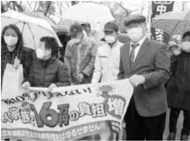
雨が降るなかデモ行進出発(中野)

中野民商は3月13日に新井薬師公園で重税反対中野統一行動に取り組み、全体で約100人が参加しました。