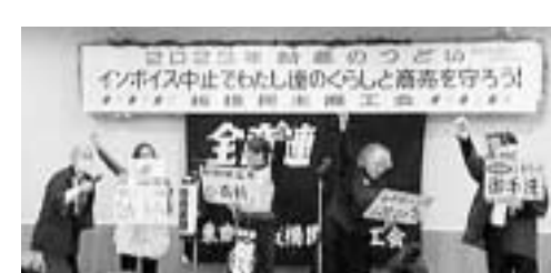
会場を盛り上げた寸劇の様子

2月4日、3年ぶりに「板橋民商・新春のつどい」が開かれました。新型コロナウイルスの感染拡大を考慮して会員だけのつどいでしたが74人が集まりました。恒例の「税務相談停止命令」を