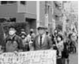
練馬東税務署に向けてデモ行進

練馬民商が所属する3・13重税反対ねりま区民集会と集団申告に138人が集まりました。練馬東税務署コースでは区民集会にてDVD学習をし、駆けつけた区議会議員さんから激励のあいさつをいただきました。