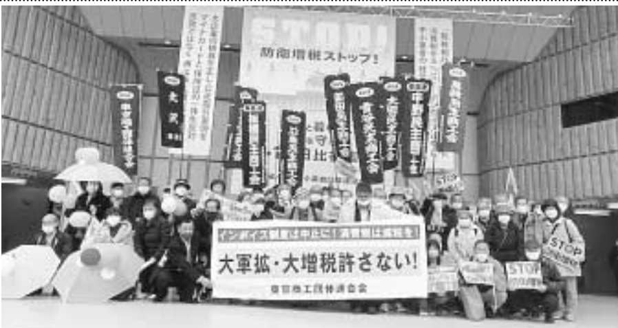
集会に参加した東京の皆さん。100人が参加しました。