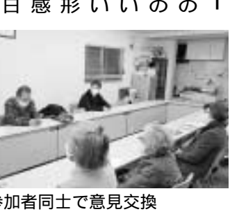
参加者同士で意見交換

「やっぱり、普段出会うことのない業種の話が聞けることは、本当にタメになるし楽しい。また、ぜひ参加したい」と感想を寄せてくれました。