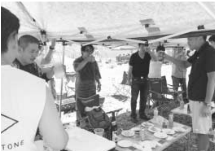
参加者みんなで乾杯！

会場に向かう途中、チ ャーターしたバスのエア コンが故障するトラブル が起きましたが、全員無 事に帰ってくることで きました。