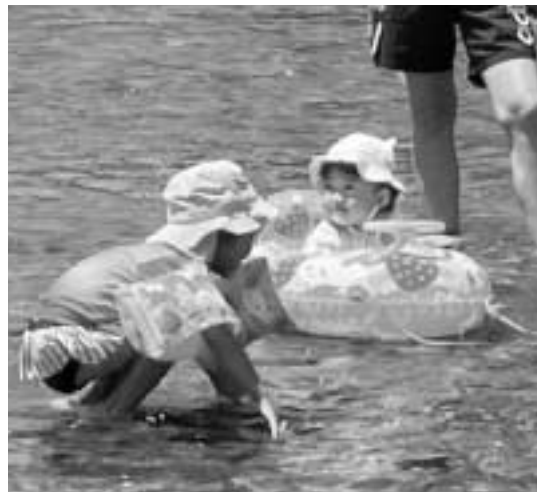
秋川で遊ぶ子どもたち

7月31日、東青協は あきる野市にある秋川河 川公園にてBBQ懇親会 を開催しました。子ども 6人を含め31人が参加 しました。