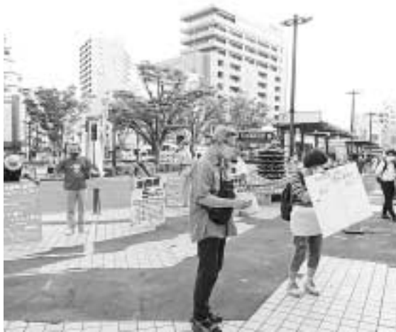
亀有駅前宣伝行動

葛飾民商も加盟する重 税反対統一行動実行委員 会、消費税をなくす会、 で「消費税を5%に引き