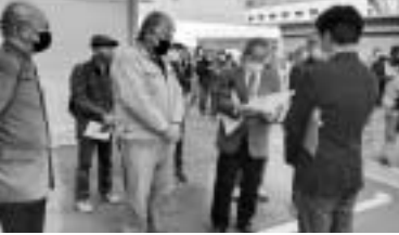
要望書を読みあげました（八王子民商）