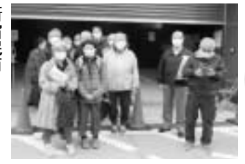
京橋税務署前にて（中央民商）