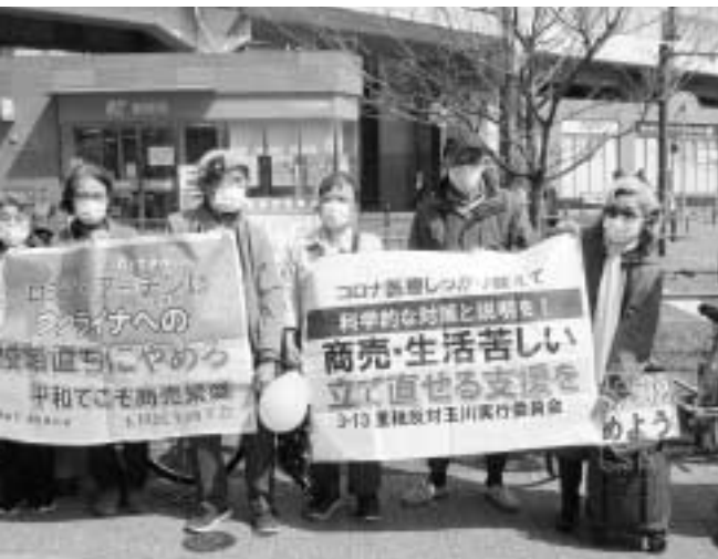
二子玉川駅前でのスタンディング（玉川民商）