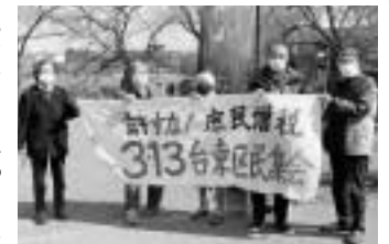
不忍池の近くで集合（台東民商）

「許すな！庶民増税 3・13台東区民集会」を上野公園内で開催。約20人が参加しました。