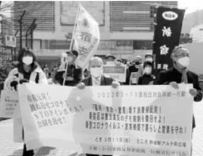
JR新宿駅前からデモをスタート（新宿民商）

「給付金を非課税とすること」「税や国保、都営住宅家賃についても特別な減免措置などに対応すること」「協力金受給によって都営住宅を退去させられることがないよう」にすることを強く要求して交渉を終りました。