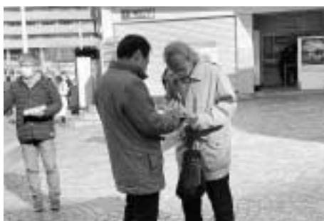
署名に応じた方と対話が弾みました

大のなかでの宣伝でしたが、3メートルの横断幕が目立ち、通行人が目を止めて見ていたり、署名板を持つメンバーに「しばしば話したむ人が何人かいました。ピラを受け取って初めて事件の受け取りも良い宣伝行動でした。結果として、1時間弱で5人分の署名が集まりました。 署名に応じた50代の女性は「この事件は、モノ言つ組織は黙らせると