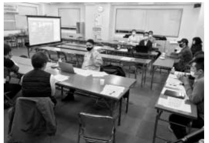
ウェブで各地の代議員とつながりました