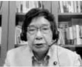
大門みきし 参院議員