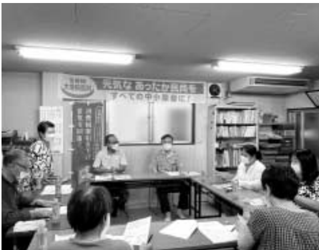
インボイスについて活発に意見交換(立川)