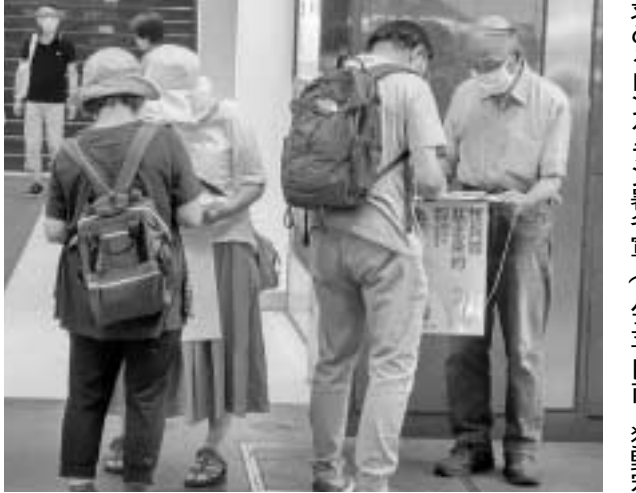
署名に応じる方々(八王子)

この条約は核兵器を法的禁止とする初めての国際条約です。圧倒的多数の国が核廃絶を求めている中、唯一の被爆国である日本はこの条約への参加を拒否しています。 「コロナ禍の為、車でのパレードとなりました。公園から区役所までの道のりを「日本は条約に批准を」などを訴えながら行われました。集会には多くの区民が参加しました。」 毎年開催されている板橋平和パレードが7月22日に開催されました。今年1月に核兵器禁止条約が発行されました。この条約は核兵器を法的禁止とする初めての国際条約です。圧倒的多数の国が核廃絶を求めている中、唯一の被爆国である日本はこの条約への参加を拒否しています。 「コロナ禍の為、車でのパレードとなりました。公園から区役所までの道のりを「日本は条約に批准を」などを訴えながら行われました。集会には多くの区民が参加しました。」 署名に応じる方々(八王子)