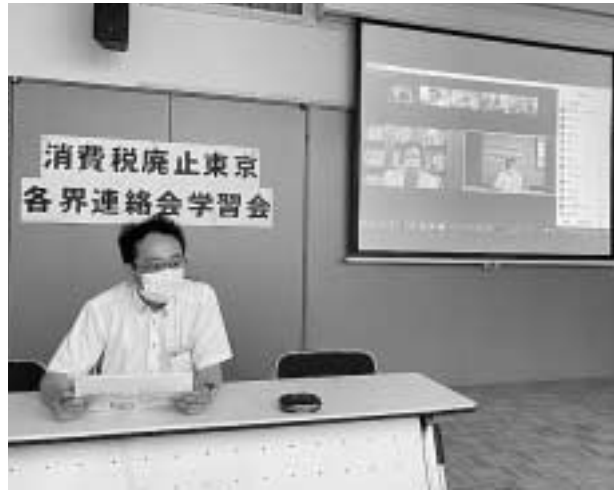
メイン会場と20ヶ所以上をウェブでつなげました

当日は会場と20カ所以上をウェブでつなぎ30人以上が参加しました。大門氏は普政権の3つの「危険性」として、