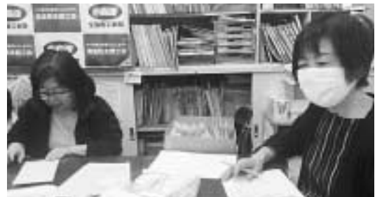
一人ひとりの状況を電話かけて確認

「部員の皆に電話して様子をおたずね」と、役員で分擔して電話かけを行いました。 「緊急宣言で予約のキャンセルが相次いだ。昨年未だに大改修工事をしてローン組んでいるので支払いが大変(宿泊業)」。3月下旬から休業している。店が開いてもこんな状態では人が来ない。家賃が大変。融資の相談をしたい(飲食業)。 「本部から営業するなど言われ売上げゼロ(音楽教室)など、商売の状況が次々と聞かれました。今回の電話かけで、開