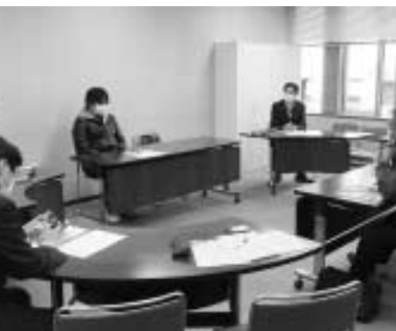
区に業者の実態を告発