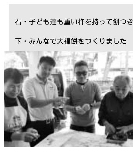
右・子ども達も重い杵を持って餅つき 下・みんなで大福餅をつくりました