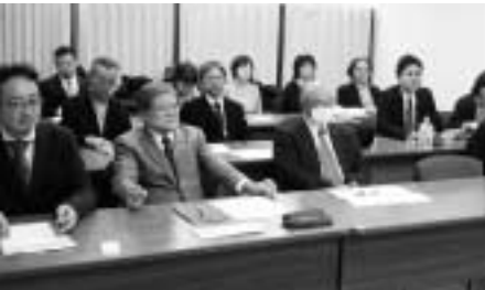
納税者の権利を守れ！

東商連と管内の千葉、神奈川、山梨の3県連は12月5日に、東京国税局と交渉した税務行政への改善を求めました。 (1) 事前通知を文書で行うこと (2) 「質問応答記録書」への署名、押印を強要しないこと (3) 「税務調査」と題した行政指導文書、お尋ね呼び出し文書、税務署の都合で来署を迫る法的根拠のない文書は乱発しないこと (4) 消費増税区分の記帳が不十分な場 東商連と管内の千葉、神奈川、山梨の3県連は12月5日に、東京国税局と交渉した税務行政への改善を求めました。 「(1) 事前通知を文書で行うこと (2) 「質問応答記録書」への署名、押印を強要しないこと (3) 「税務調査」と題した行政指導文書、お尋ね呼び出し文書、税務署の都合で来署を迫る法的根拠のない文書は乱発しないこと (4) 消費増税区分の記帳が不十分な場 東商連と管内の千葉、神奈川、山梨の3県連は12月5日に、東京国税局と交渉した税務行政への改善を求めました。 「(1) 事前通知を文書で行うこと (2) 「質問応答記録書」への署名、押印を強要しないこと (3) 「税務調査」と題した行政指導文書、お尋ね呼び出し文書、税務署の都合で来署を迫る法的根拠のない文書は乱発しないこと (4) 消費増税区分の記帳が不十分な場