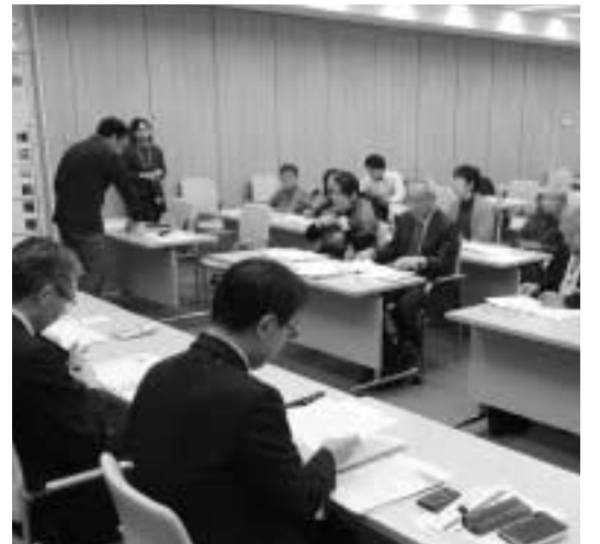
業者の切実な問題を訴えました