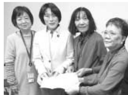
要請に応じる日本共産党田村智子議員

1月27日、全商連 恵民民主党や国民民主党、婦人部協議会主催で所得税法第56条廃止を求め、56条の廃止と消費税法第56条の矛盾を告発する請願署名の提出行動がありました。遠い山口県請願行動に取り組みました。東婦協は4人が参加しました。 国会情勢報告に駆け付(業者婦人やその家族)が毎日本共産党の議員を訪問し、56条の廃止と消費税法第56条の矛盾を告発する請願署名の提出行動を行いました。働き分を認めない、ジェンダー(自家労働)は、日本の税制制度では経費に認められない、一刻も早く廃止にしよう」と訴えました。 集まった署名数は約1万3千人分。集会後は、立