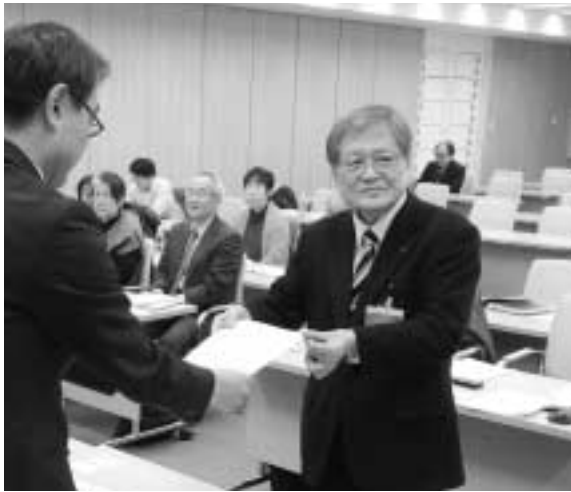
要望書を担当者へ手渡す

【東京都回答】 滞納処分は当たっては法令順守で行っている。市区町村には研修などで周知しているが、都に指導権はない。